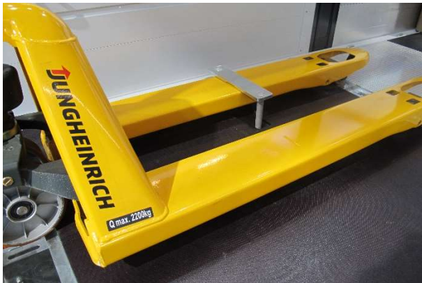
Pompwagenezekering links achter verzonken in de vloer