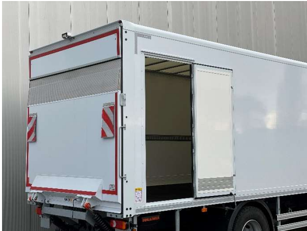
Enkele zijdeur ca. 950 x 2.000 mm. Plaatsing rechts achter of ca. 1.000 mm vanuit de voorwand (rechts)