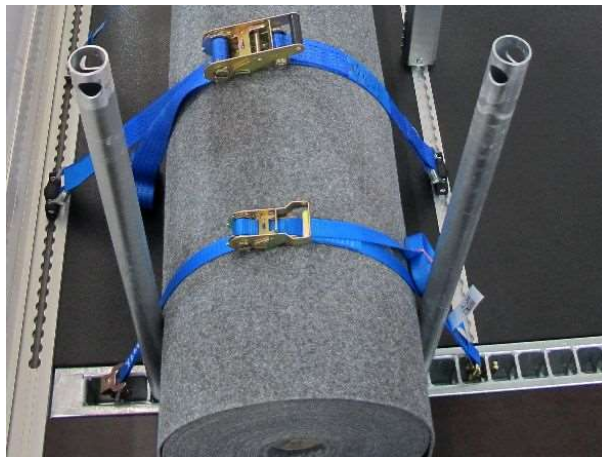
Speciale ladingrail en vliegtuigrail (optioneel)