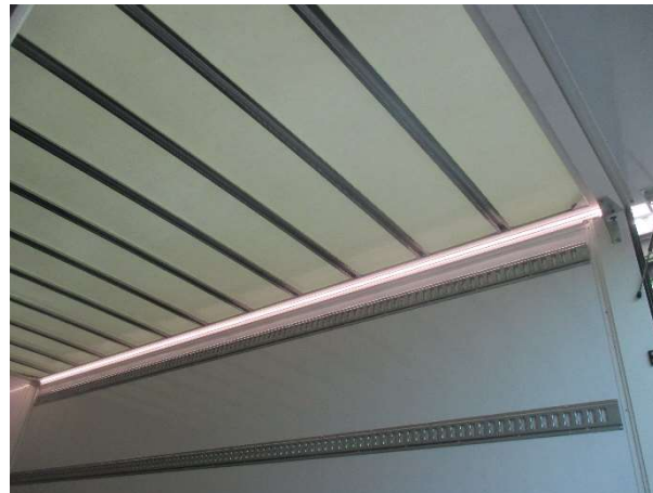
LED lichtstrip standaard in de rechter bovenhoek over de volledige lengte. Optioneel verkrijgbaar inclusief bewegingsmelder