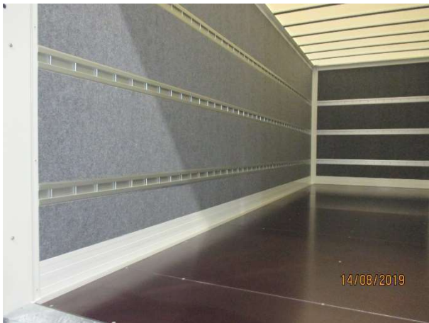
Speciaal voor meubelvervoer: 3 rijen staafjesrail tegen de zijwanden en voorwand; zijwanden bekleed met vilt (optioneel)