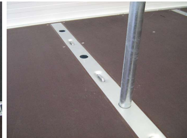
Multirail voor verticale vergrendeling (optioneel)