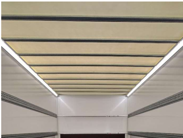
Optioneel verkrijgbaar links en rechts Optioneel verkrijgbaar inclusief bewegingsmelder