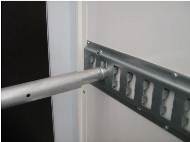
Verende ladingstang (standaard)