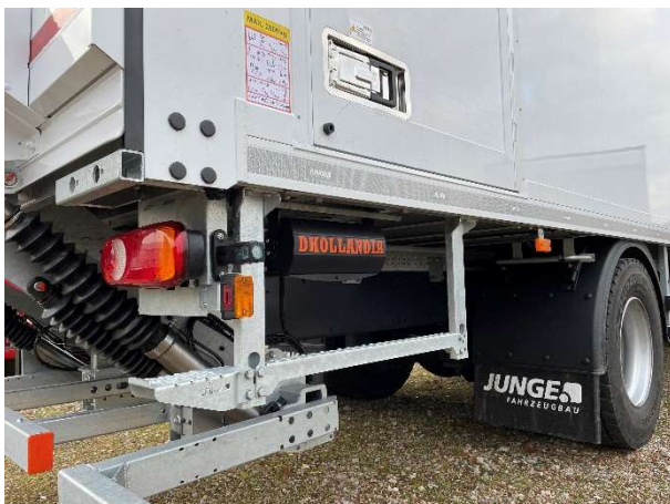
Luxe comfortabele opstapbeugel inclusief instaptrede voor achter