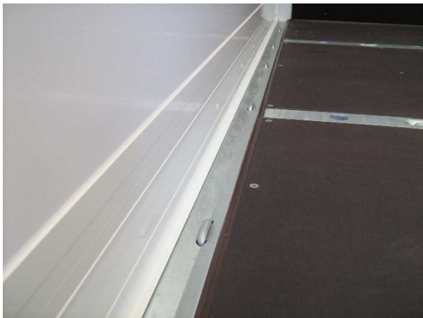
Sjorogen verzonken (optioneel)