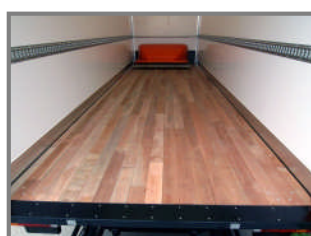
Hard houten vloer