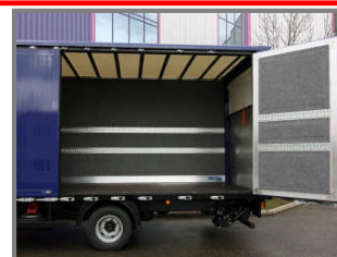
Zijwand voorzien van vouwdeuren