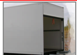
Geïntegreerde greep in het achterportaal