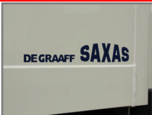
Stabiele opbouw constructie