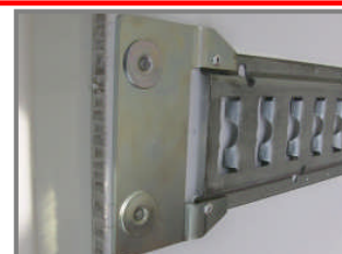
Stabiele lichtgewicht elementen