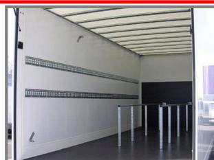
Rekken voor belading van rolcontainers