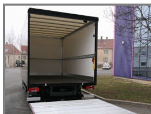
Laadklep volledig sluitend

De Graaff Carrosserie Dorpsstraat 18 2761 AE Zevenhuizen