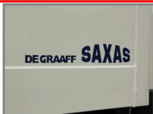
Stabiele opbouw constructie