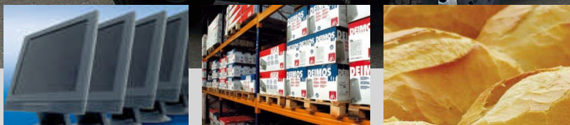
Afbeelding wijkt af van standaard